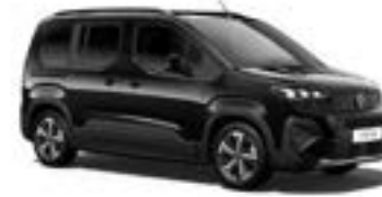
Perla Nera Schwarz