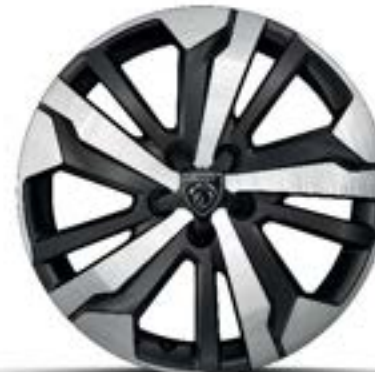
GT - Serie