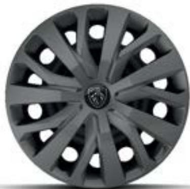
ALLURE - Serie

Stahlfelgen 16" mit Radzierkappen TONGARIRO