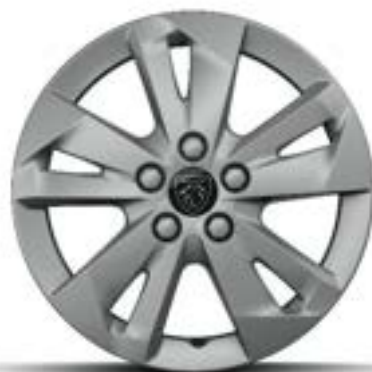
ALLURE – Option

Stahlfelgen 16" mit Radzierkappen TONGARIRO