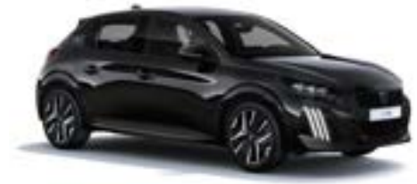
Perla Nera Schwarz