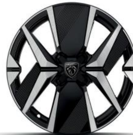
16" Leichtmetallfelge YANAKA