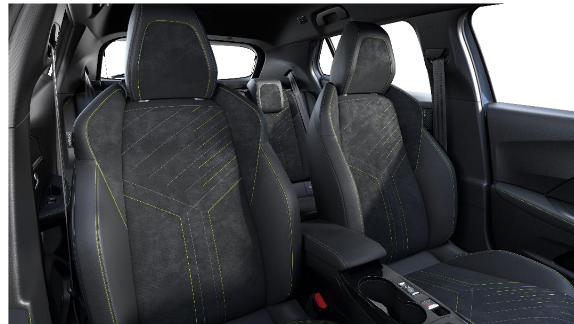
Stoff / Kunstleder BELOMKA mit Ziernähten Adamite Grün