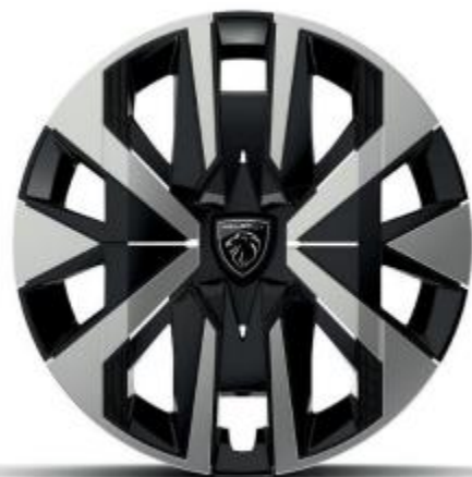
16" Radzierkappen MONTI