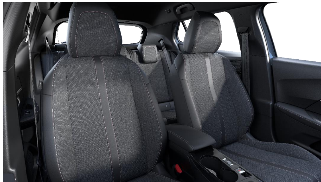
Stoff / Kunstleder CASUAL LOMSA mit Ziernähten Quartz Rosa