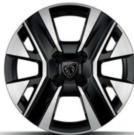
16" Leichtmetallfelge NOMA