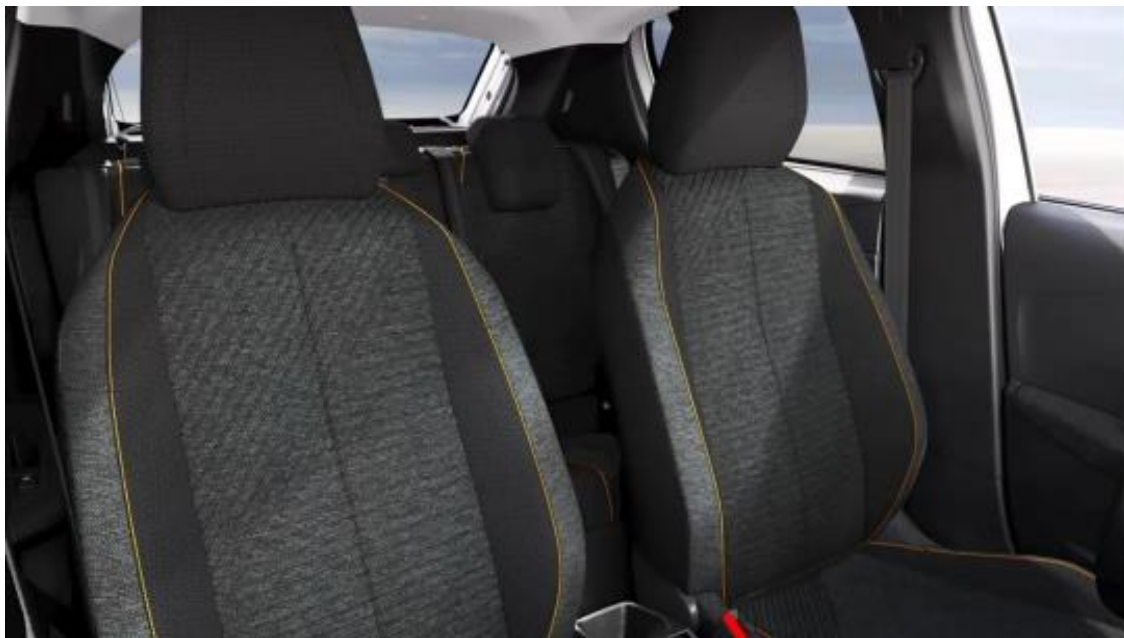
Stoff RENZO mit Ziernähten Sunrise Orange