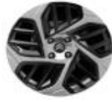
18 Zoll Leichtmetallfelgen CAMELIA grau